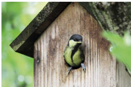
Beim Naturmodul «Vogelnistkasten» kommen nicht nur Meisen vor Freude ins Singen.

MIT WENIG AUFWAND KANN DAS SUMMEN UND ZWITSCHERN VON TIEREN UND DIE PFLANZENVIELFALT IN DEN SIEDLUNGSRAUM ZURÜCKGEBRACHT WERDEN.