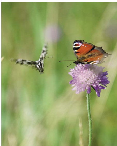
Das Naturmodul «Schmetterlingsbeet» ermöglicht kurzweilige Naturbeobachtungen.