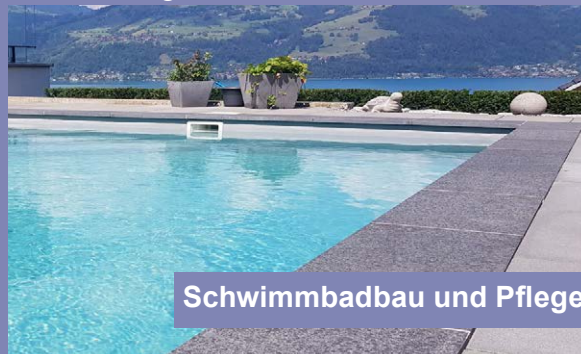
Schwimmbadbau und Pflege