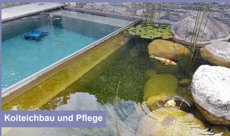
Koiteichbau und Pflege