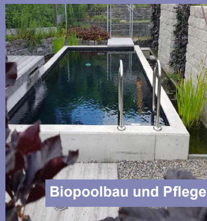
Biopoolbau und Pflege

Yasiflor GmbH Gartenbau + Schwimmteichbau