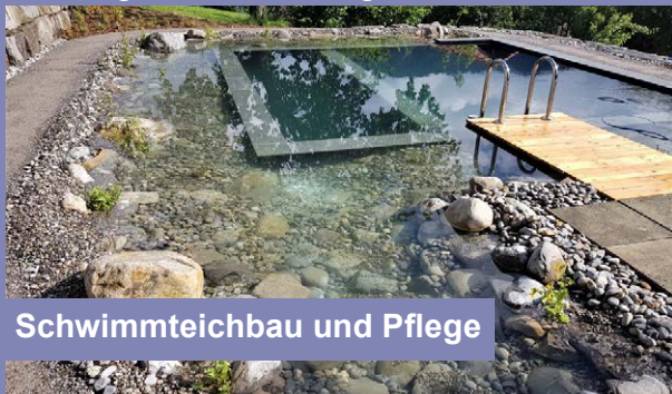
Schwimmteichbau und Pflege

Planung, Bau und Pflege aller Wasser- und Gartenanlagen aus einer Hand